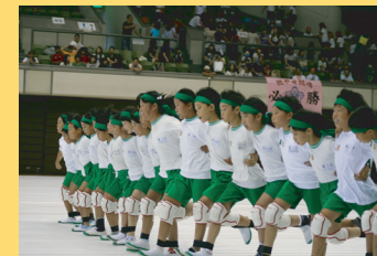
青少年心身育成事業 (スポーツチャレンジぎふ)

また、私たちは、夢を持った子どもの成長を願うと共に、みんなで一つの目標に向かい、困難を乗り越える過程を通じて、仲間との友情を深めることができる機会を提供することで、まわりの人々へ感謝する心を育てていきます。