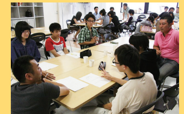
中高生サポーター会議