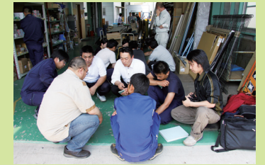
企業交流 (経営改善塾)