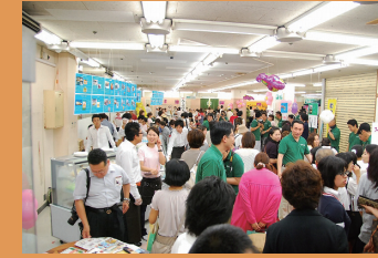
中心市街地活性化事業 (スイーツフェスタぎふ)

ぎふのまちの人々と共に、みんなが愛せる魅力に満ち溢れたぎふのまちを目指し、中心市街地の活性化をはじめ行政と積極的に意見交換をして、日々様々なまちづくり活動を行っています。