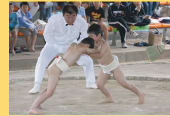
青少年心身育成事業 (わんぱく相撲)

私たちは、思いやりの心で万事に感謝でき、すべてのことに愛を持って関わっていける子どもの育成を目指し、様々な事業を行っています。その事業を通じ、親と子どもとの心の繋がりを深めていきます。