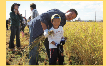
青少年心身育成事業 (稲作プログラム)

また、私たちは、夢を持った子どもの成長を願うと共に、みんなで一つの目標に向かい、困難を乗り越える過程を通じて、仲間との友情を深めることができる機会を提供することで、まわりの人々へ感謝する心を育てていきます。