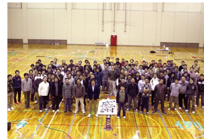
会員交流例会 メンバー同士が交流を深め喜びを分かち合い仲間との友情を育み組織としての結束を高めます