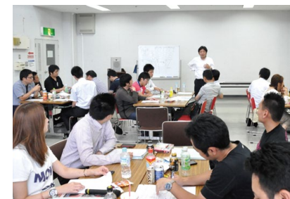
人間力向上セミナー 専門的な分野のみならず幅広い知識と教養と経験から「自由な発想」を生み出すこと、失敗を恐れない「大胆な行動力」を身につけます

問題が複雑化し、変化の激しい時代を逞しく生きていくためにも、既存概念にとらわれず価値観の枠を広げ続けられる人を育成し、人間力の向上に繋がります。 自分が知らない考えや、物事に対する捉え方があることを知り、学び続けることで多くの発想が生まれること、周りの目や失敗することを恐れず大胆な行動を起こすことの重要性を学んでいきます。公開例会では、市民の方にも学び続けることの重要性を伝えていきます。