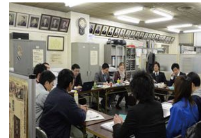
委員会風景 組織への誇りをもったメンバーが同じ目標に向かって仲間と共に切磋琢磨し活動しています

岐阜JCでは、様々な考えや背景をもった仲間たちと切磋琢磨しながら活動することで自身の価値観の幅を広げることができます。そして、ぎふのまちのために成果をあげることで、仲間たちと達成感と喜びを共有し友情を育むことができます。 メンバーが気持ちを一つにし、組織への誇りをもって、生き生きとJC活動に取り組むことで、関わり合う人々を巻き込んでいき、活動を通し市民や地域から共感や理解を得られる組織を目指します。