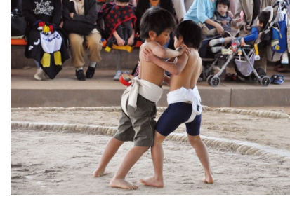
わんぱく相撲「岐阜場所」 相撲を通じて、礼儀礼節を学ぶ中で感謝の心を育み、事業を通じて挑戦する意欲を養うことを目的としています