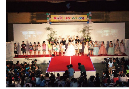
キッズドリームワークス 職業体験を通じて、働く大人の姿から、未来の自分を想像し、夢を描き、挑戦する、勇気と思いやりの心を育てていきます

子どもたちが、どのような社会や環境でも夢や目標を自分で設定し、自らの理想に向けて進んでいける逞しい人になって頂けるように事業を展開していきます。 子どもたちには、やり遂げたという達成感から新たな挑戦へ向かう勇気を育てていきます。経験を通して自分の可能性を感じることで、未来へ夢を描きかけとしていきます。 また、多様な価値観をもつ様々な人と協力しながら、ものごとをやり遂げる中で、コミュニケーションの大切さを学んでいきます。