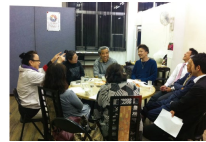
それぞれの夢を取り入れ、強みを活かしたぎふのまちの賑いに繋げる活動をしていきます

地域に生まれ始めた主体的な協働の和を広げると共に、まちづくり運動ビジョンのもと、ぎふのまちの地域資源を活かしたまちづくりを展開していきます。 岐阜JCがコミュニティシップ(※1)を発揮し、コミュニティや企業、行政との協働を通して、それぞれの夢を取り入れ、強みを活かした活動ができる事業を創っていきます。 そして、多くの人の意見を取り入れたぎふの新たな風物詩を創っていくことで、ぎふのまちに一体感を生み出していきます。