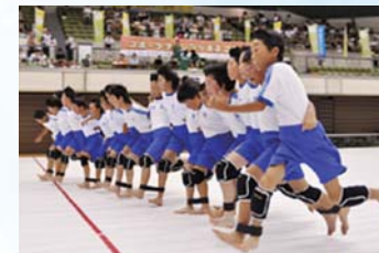
スポーツチャレンジぎふ

未来を担う子どもたちの健全な育成を目的に様々な事業を展開しています。その活動を通じて地域の人々との絆を強め、夢と可能性に満ちあふれた子どもたちを共に育てていきます。