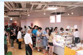
スイーツフェスタぎふ

市民が生き生きと魅力を語れるまちを目指して、中心市街地の活性化をはじめ、行政と積極的に意見交換するなど、ぎふの宝である伝統・歴史・文化を活かした様々なまちづくり活動を行っています。