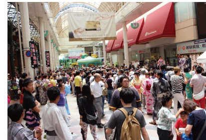
まちづくりイベント(仮称) ぎふのまちの地域資源を活かした新たな風物詩となるような、まちづくりを行っています