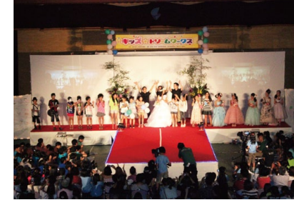
キッズドリームワークス 職業体験を通じて、働く大人の姿から、未来の自分を想像し、夢を描き、挑戦する、勇気と思いやりの心を育てていきます

子どもたちが、どのような社会や環境でも夢や目標を自分で設定し、自らの理想に向けて進んでいける逞しい人になって頂けるように事業を展開していきます。 子どもたちには、やり遂げたという達成感から新たな挑戦へ向かう勇気を育てていきます。経験を通して自分の可能性を感じることで、未来へ夢を描きかけとしていきます。 また、多様な価値観をもつ様々な人と協力しながら、ものごとをやり遂げる中で、コミュニケーションの大切さを学んでいきます。