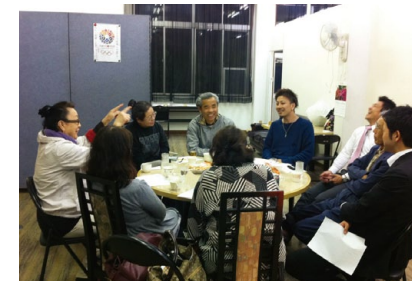
それぞれの夢を取り入れ、強みを活かしたぎふのまちの賑いに繋げる活動をしています

地域に生まれ始めた主体的な協働の和を広げると共に、まちづくり運動ビジョンのもと、ぎふのまちの地域資源を活かしたまちづくりを展開していきます。 岐阜JCがコミュニティシップ(※1)を発揮し、コミュニティや企業、行政との協働を通して、それぞれの夢を取り入れ、強みを活かした活動ができる事業を創っていきます。 そして、多くの人の意見を取り入れたぎふの新たな風物詩を創っていくことで、ぎふのまちに一体感を生み出していきます。